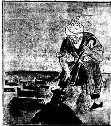
Molla Nəsrəddin əsqi əlifbanı qorba-qor ələməq istəjir.

Qəçəjdən vastikə və səgən qə- dində olan məsələ barədə jəzən joldəsa həmin məsələ qəhnədir, bildir gəzələrdə jəzılmədi.