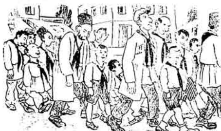
3yazda pioner dastasi jaxdy iran kosıny.

3yazda pioner dastasında 8 jazından 28 jaza kadar vardu.