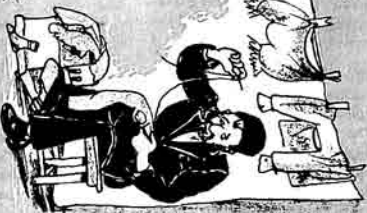
6 Palları özəqəsinə yədyrməgə arval razi olınyr.