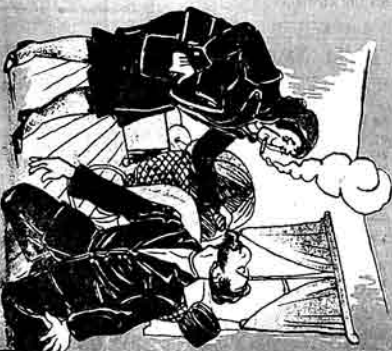
8 Evlə supurnadılma qəza arval danlıdır.

Q:31 — H-ni, o zamanlarqı beca arval qabın edib hərəsini bir isə qəndərçidim bəzədə bir arval manə on isə qərdurur.