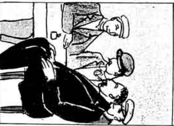
qand syrasinda -