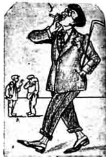
Mənimlə iqlə - dızdən bydə təməlləyə ləpəlil ləyl - nəvəmə - əmmə dətəyby

Bəni səldi, by təməllik gəmə, bin bələjə qəfəzil Səfər oldy əm-əymə Jət əzər hərajə qəjizlə Hacı, Həjdər oğlı, Həjdər, Həmi lut səməjə qəfəzil Hərə əldə bir supurqə dytərak kəzəndi, kərdəs!