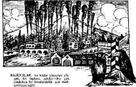
BAJKYƏLƏR: nə kədar yəşərkə ylə-ək, bər jəğdəş jəkdyr—bız çək ylədəcəq by binalərdəhə çək məh-qəmləyəcəq.