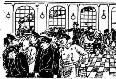
Dəmir jol iqliləri - (qəyqlər) vaxtda olın byrədən bizi əzəm sətən iqlisi qəre bilyə.

(Axsə vaktlarda 88 nəfər dəmir jol iqlisi oğrylkə dıtylyblar gəzələrdi.)