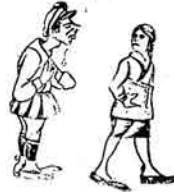
Komsomolçy əjyb həkərdijof də,ir: —Şə'la şə'la aqlama Belinə qəmar bəqləmə Son manimsən mən sənni Əzəqə quman əjləmə.