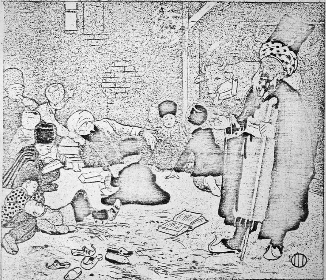
(Кавказ. Мусульманская духовн. Семинарія.) • تاشقازده مدرسه روحانیه •