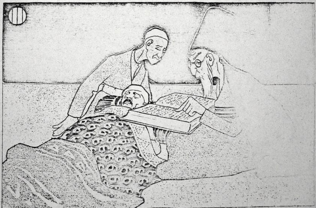
بر دغان قنایات صوبی ایچ در ایلی ساقده بردننه دی : یا قدح یا قدوح