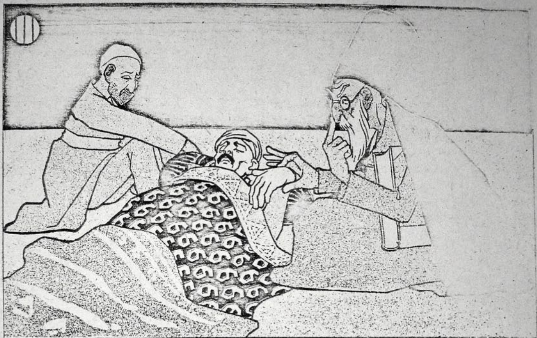
میزیم سبب آزارش ذات المطلقه در