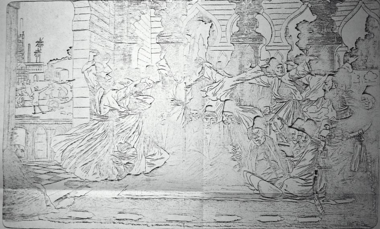
سلطان عبدالحمید خان نایب امپراتور ترکمانستان عالی