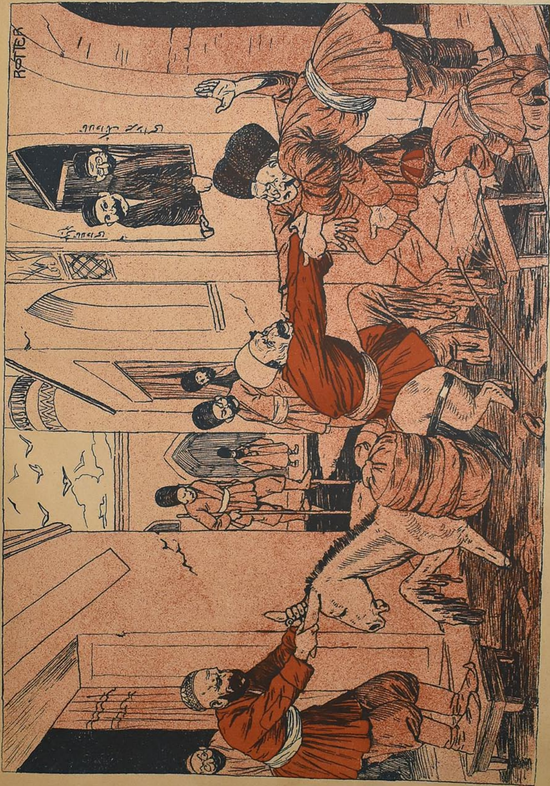
شیرا داره سنگ قبا قنده