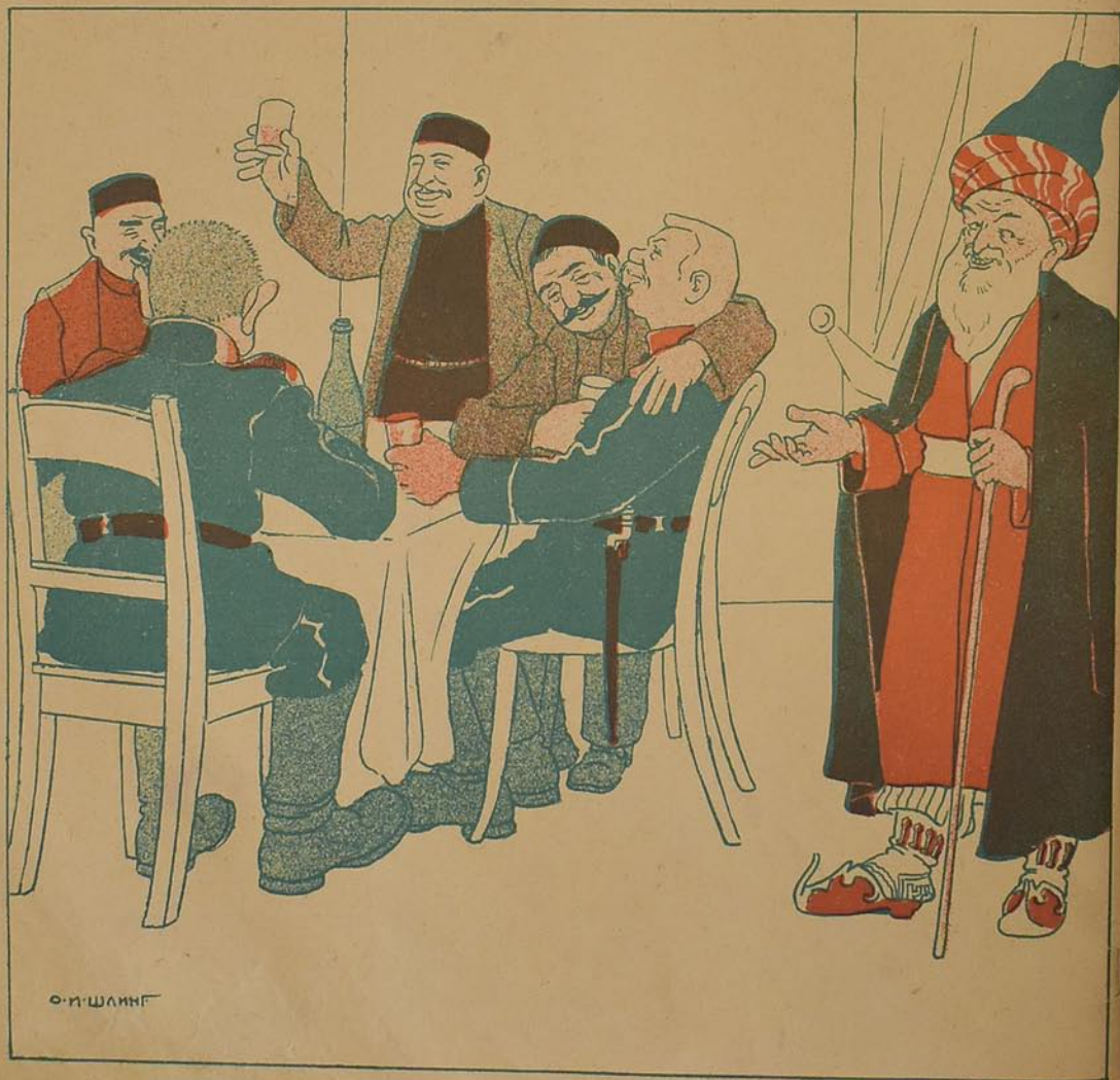
قریان اولسون گانم جانم آقا سالات!