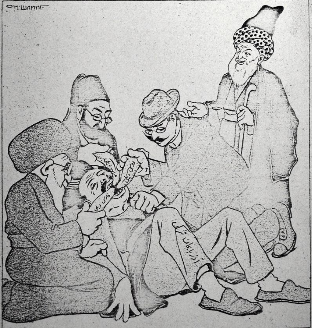
..... آی فادر اشلدر 'من که دیل سز خلق اولونامشام بو دیل ری آفریما سوخورنگز ...