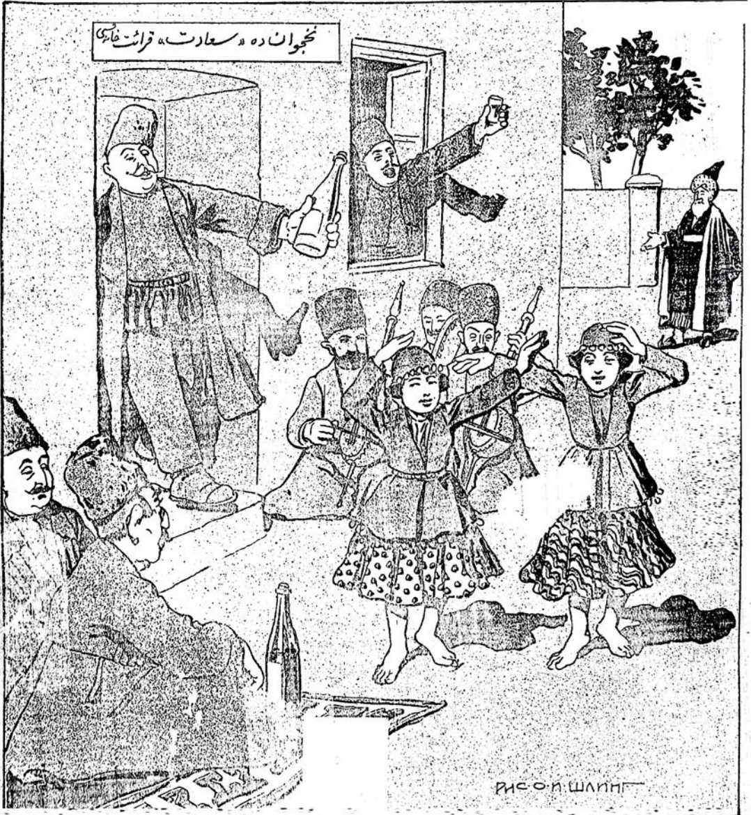
рис. О. ШАНГ