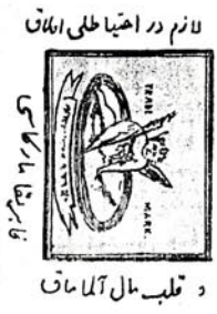
د قلب مال آلاماف فایر قفانگ مارا ماری

آزبائی «غرامفون» ۱۰ شکر نیک تفلیس ده کی شمه کی آدریس تفلیس غولوزنده کی گودمه نومه میلوزاف آدریس : تفلیس غرامفونیا