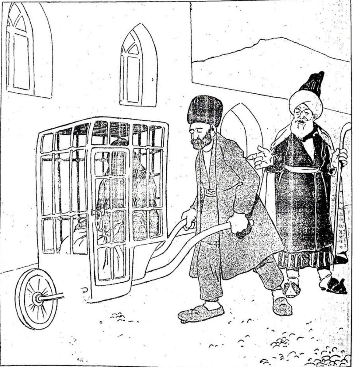
آتا و آروادا اعتبار يوفدى . (عمام سفرى)