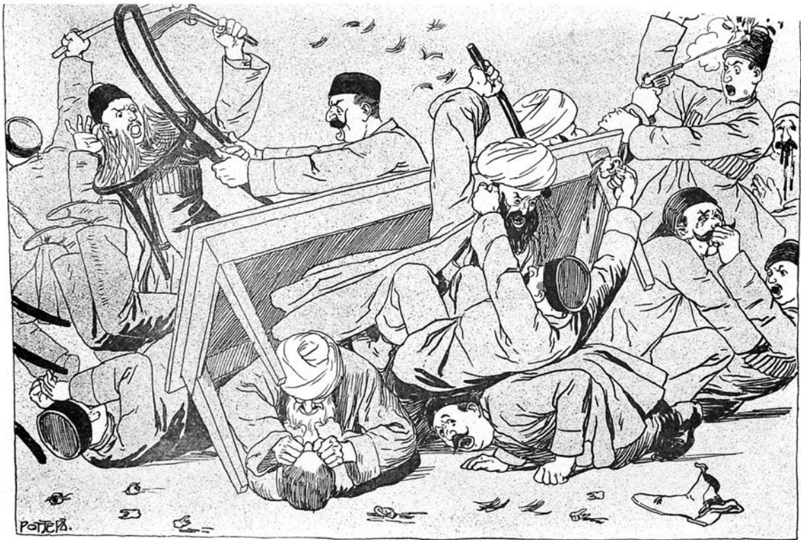
« جمعیت خرابه »