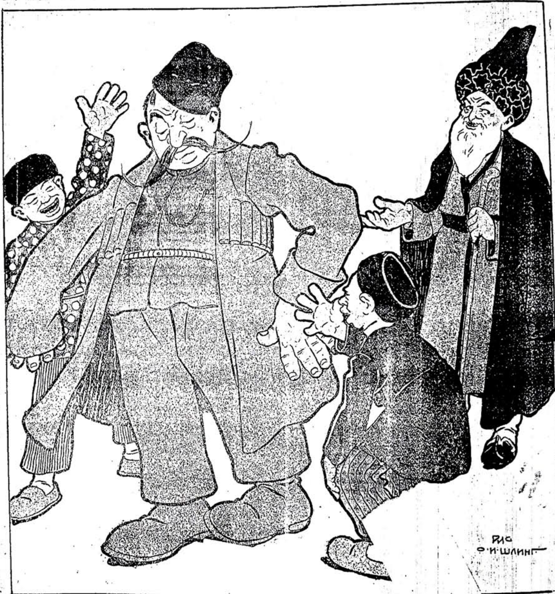
Рис О. И. ШАНГ