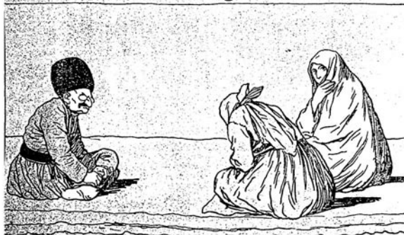
گنه بر ساعتدن سوکرا