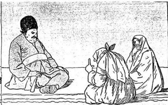
بر ساعتدن سوکرا