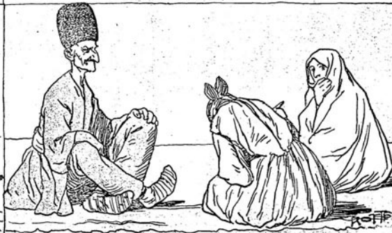
گنه بر ساعتدن سوکرا