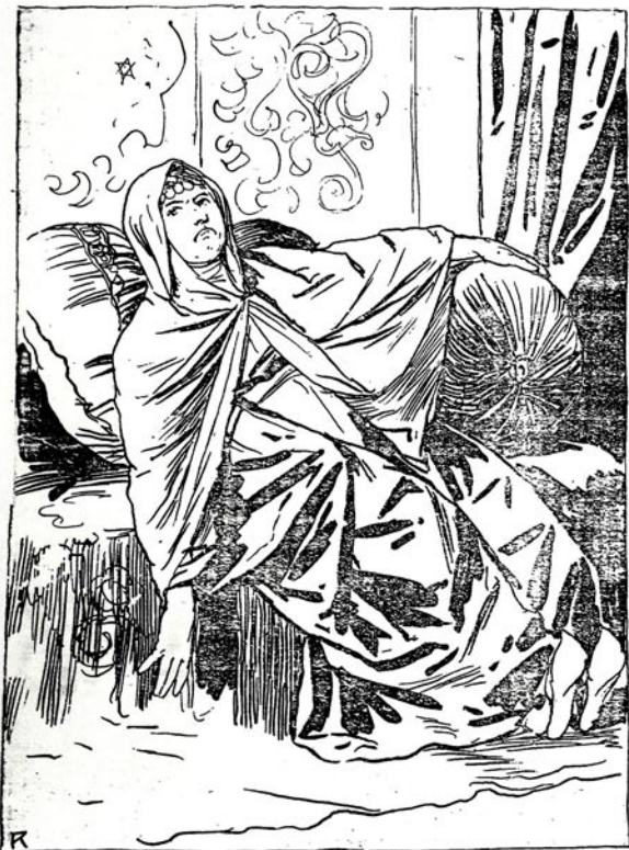
آره گیدند نصوخرآ