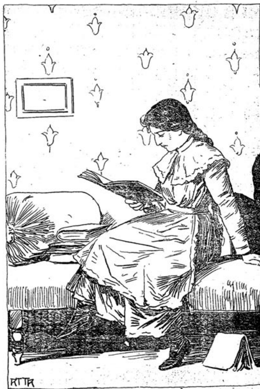
درس تو نارا نده