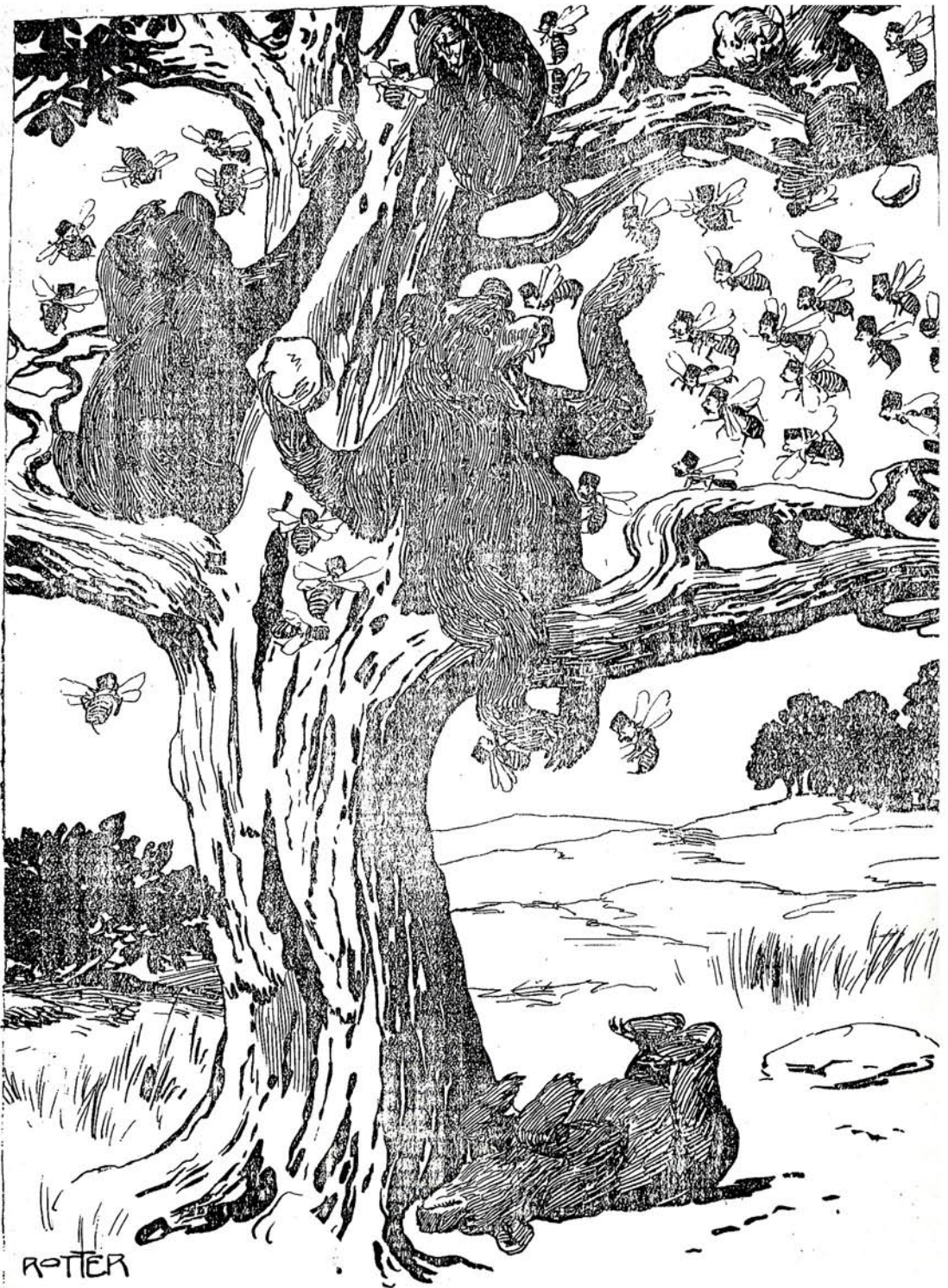
بها کو فله سنده مرتضى قلی خان اید مجا ہد لرک (عواسی)