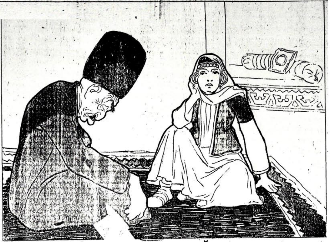
اول بید اولور