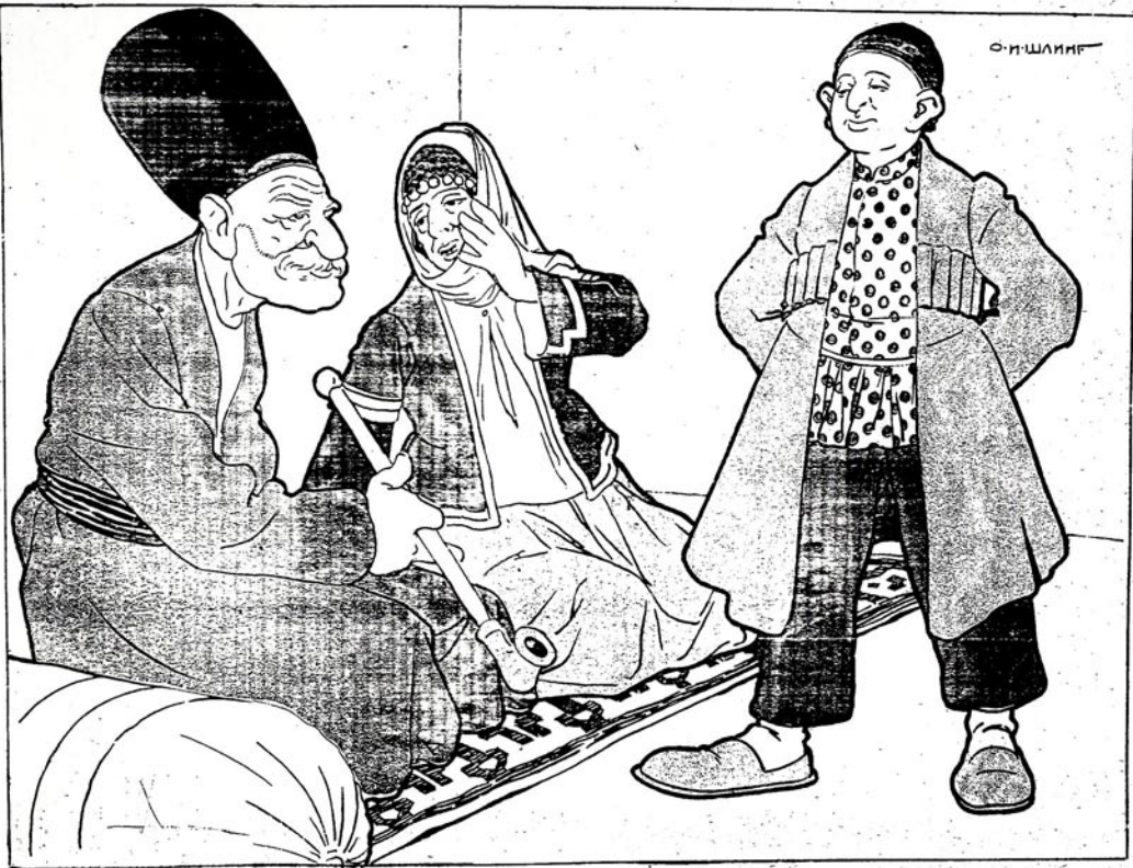
آکھ... او اعلان لای بیکه لوب دیز یخ اولدی... بیه نه واقف تونی اولوز سره مک