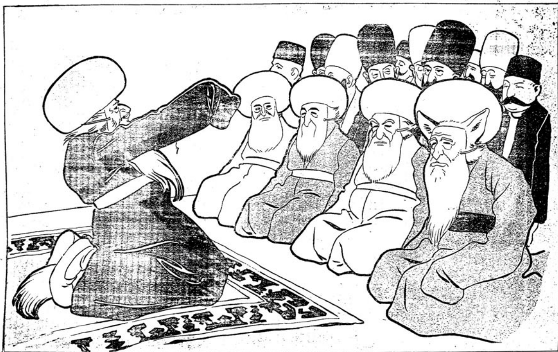
ایکچی پردہ ( ایراندہ «سنا» مجلسی )