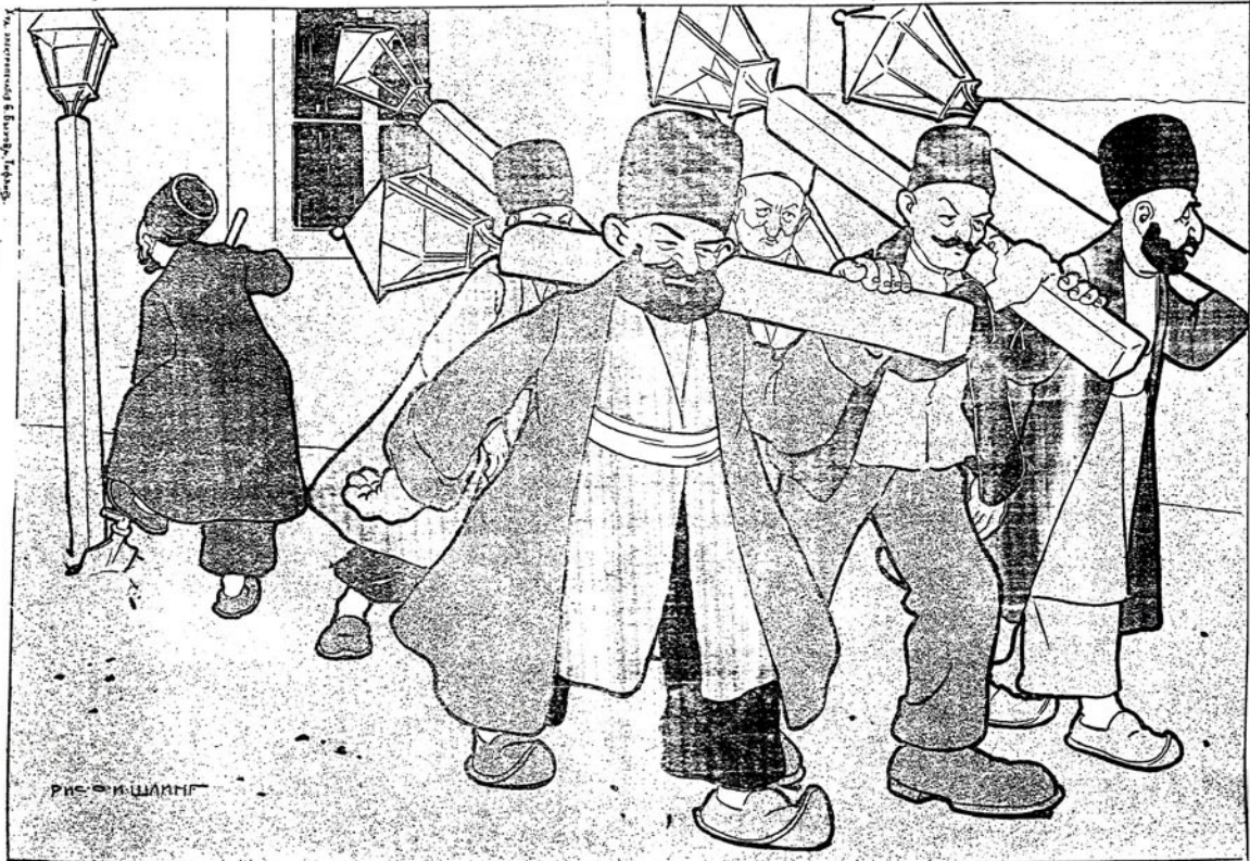
نېچوان ده غارادسقوی دو مانک تازه عضو لزیبک ایولرینک قباغنه آ پاربرلار