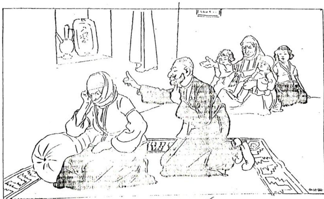
وقد جاء التازة و ذلك الكرنه -- آنا، موزاره قوناخ کیم؟ -- کول آنا کک باشنه ...