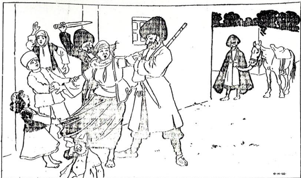
آسمانخ ابرو لاری قیز قاچیر ماغی لهنر حساب ایبر لر، دورت اوشاغ آنا سندن خبر لری یوخ!