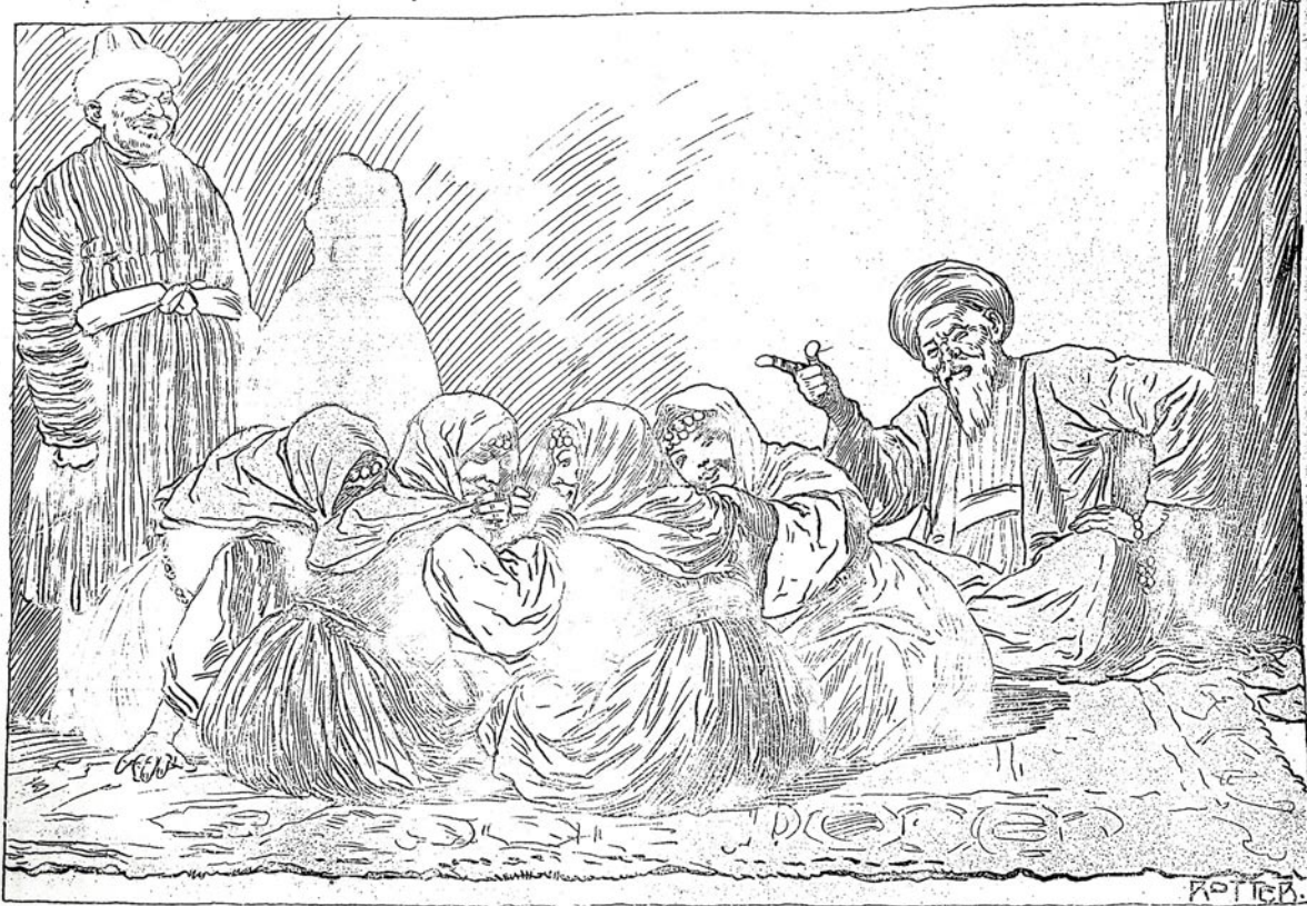
عبادتوں کو سکھانا (تاتاروں کے لئے)