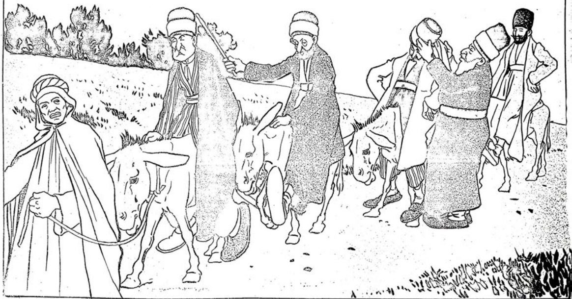
Корде بيرده حاجي لار ПО ДОРОГЪ ВЪ МЕККУ.