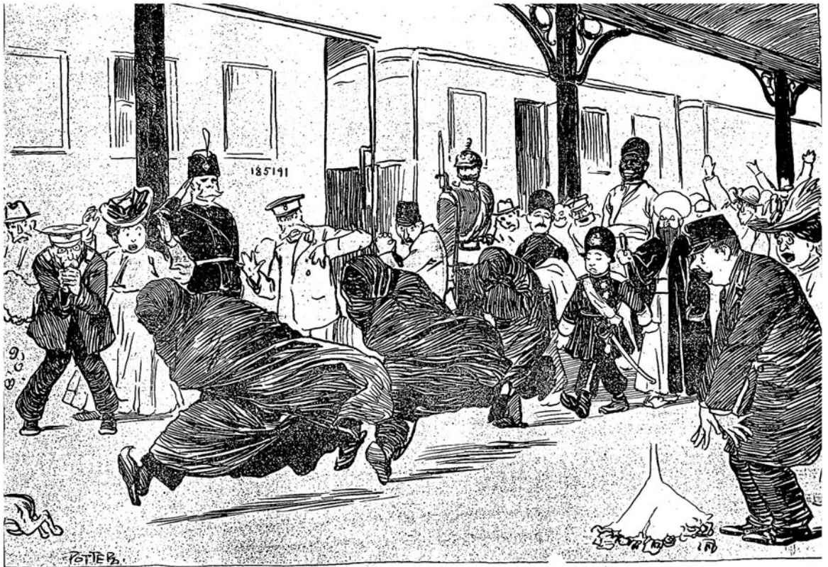
داغندن چيغان کي اوجا ساغر اجني اردن اولکوب قاپير لار کناره .