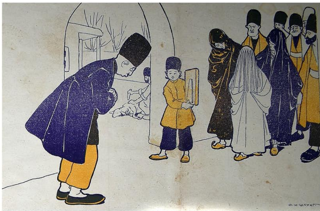
تازه گلینه احترام