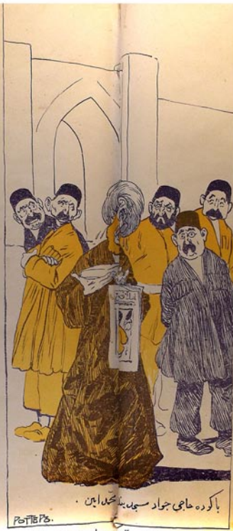
با کرده حاجی جواد سید بله بخدا این .

نه به لازم بوخواب مسجدا لر بوخبر سوز داشلار دوبره ک آخاق انگلیس لره قویسون گتسون .