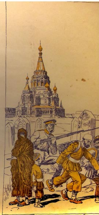
با کرده مسلمان تبرسانغی