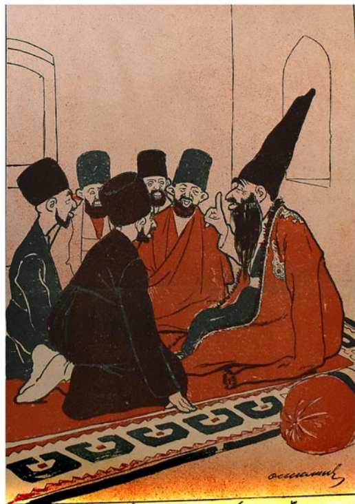
بر اذننده بر ملت یو خدی که سلمان آدی گلکنده تر تر تیره مدین ... میج بر پادشاه بزیم سلمان پادشاهلاری ایله دعوا ایلیه بیلر ...