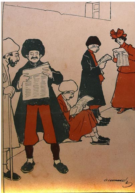
دعوا خبر لری و ایرینی لر