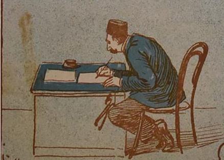
تاجر اوزیرنده، ملاه اوزیرنده، رعیتک ده لورچی بونلاره امان