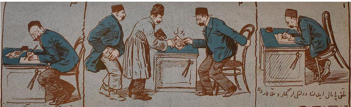
ملتی پامال ایڈن دولتی لر بگلر و ملا لاری