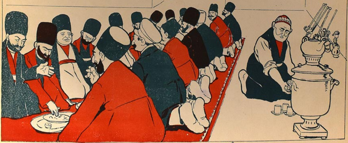
مولود گونی مسجد ده تونا خلق

بِسْمِ اللَّهِ الرَّحْمَنِ الرَّحِيمِ الْحَمْدُ لِلَّهِ الَّذِي خَلَقَ لَنَا مِنْ دُونِهِ الْحَيَاةَ وَمَا كُنَّا لَهُ شَاكِرِينَ