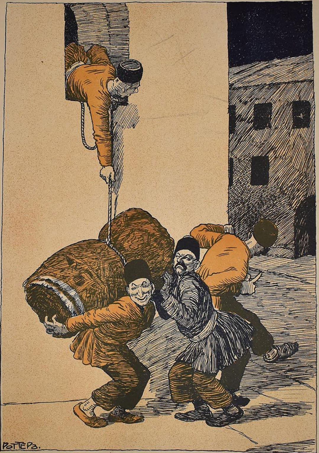
تفلیں ده سلمانلار مسجد دن خلیجه لری اوغور لیوب آپاریرلار .