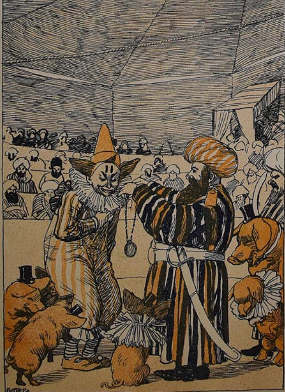
بخارا ایری سیرق صاحبی دورومہ قیمتلی میدال باخشیور