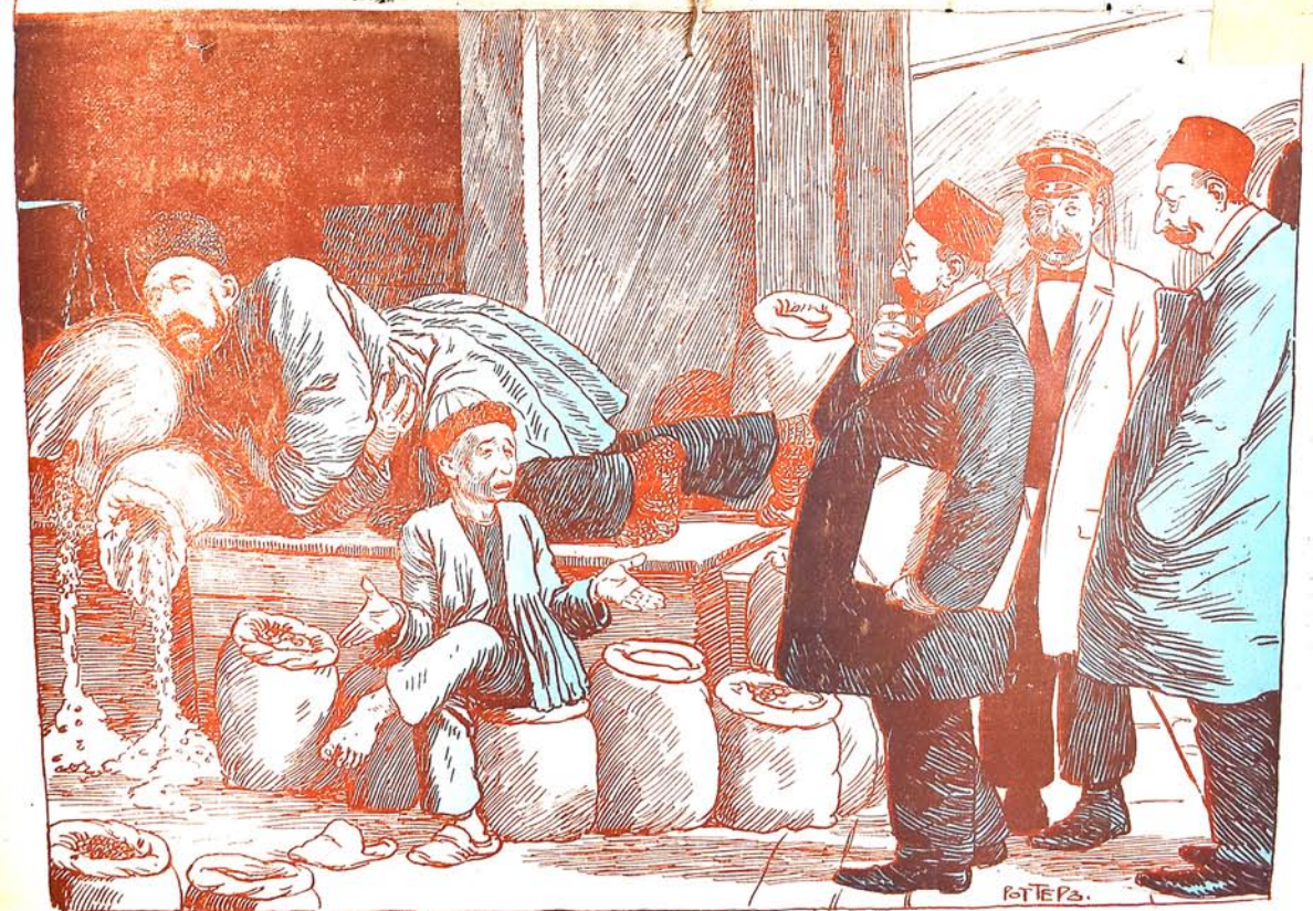
( دکیل لر ی گورن کی حاجی اوزانوب اوزینی دیریر یوخیا )

شاگرد : آغالار 'دالله ایکی ساحات اولار که حاجی یوخلیوب' سن اربابا بیله نم