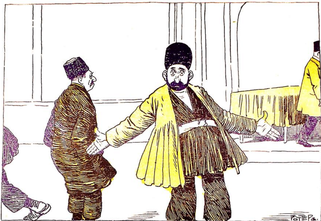
اد چو بجی دند