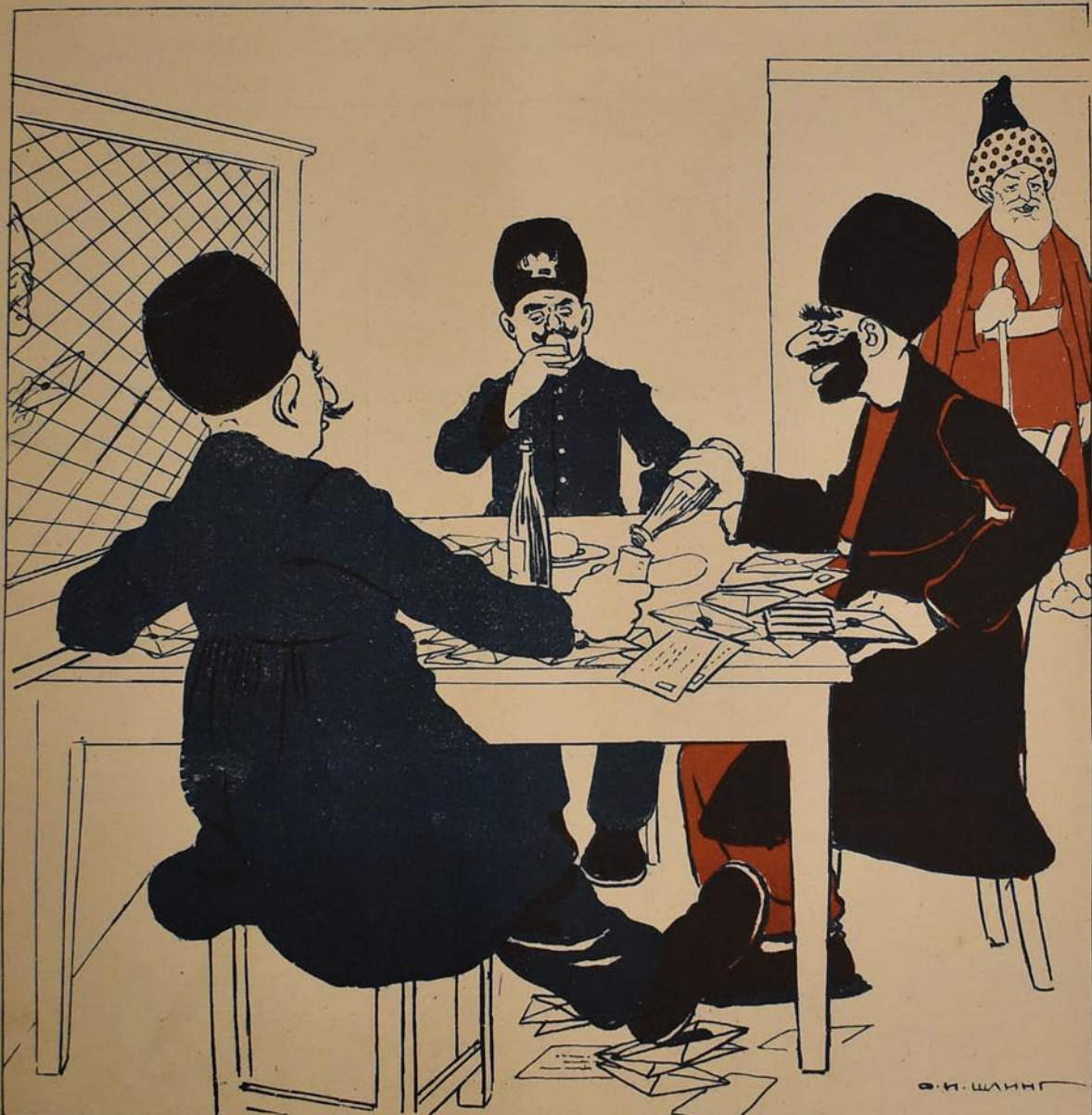
ايرانده پوچتا قانتوراسى

۲۷ اوچوچى ابل МОЛЛА НАСРЕДИНЪ نيمى ۱۲ قېك № 27