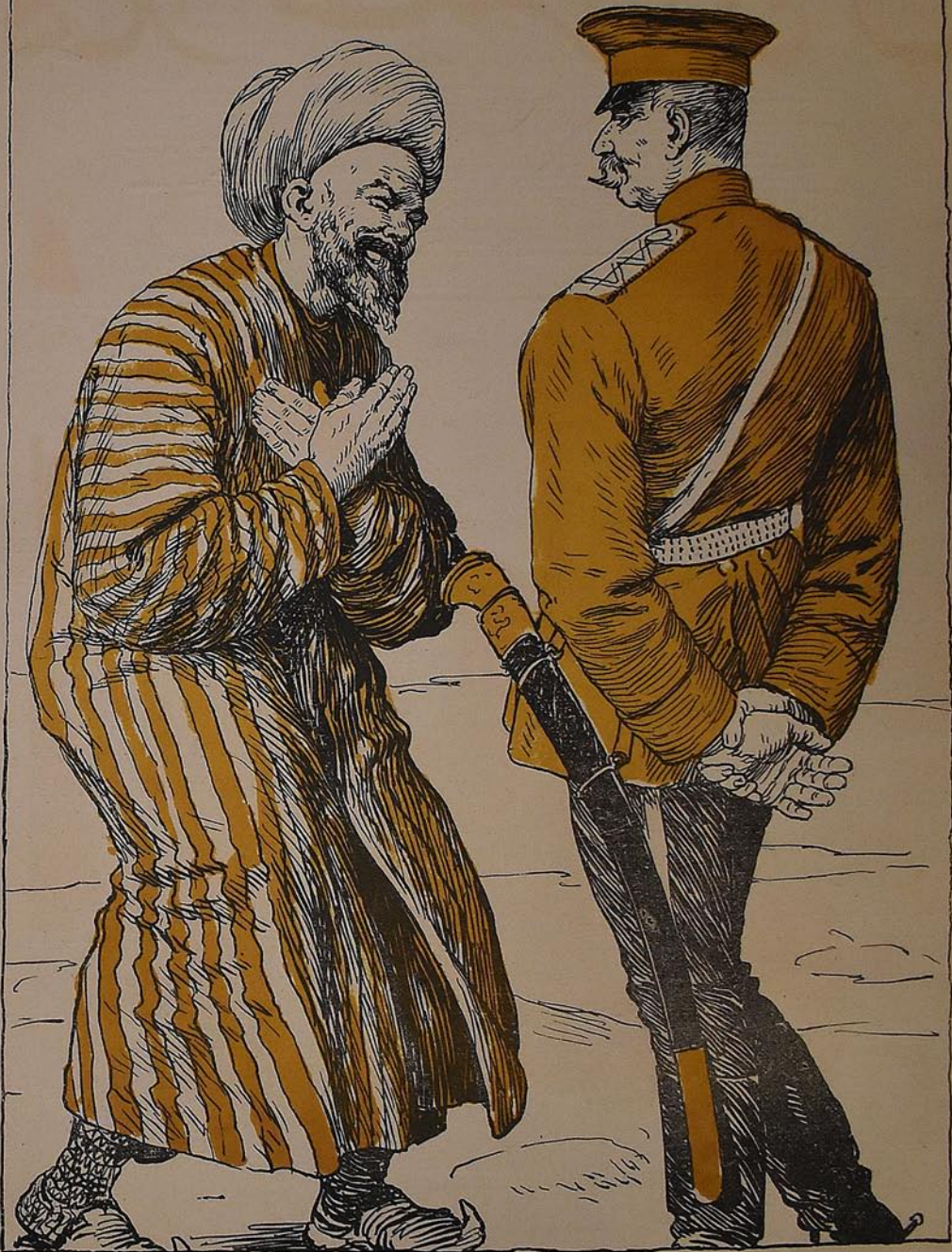
سبريامه توسط شهزده مدرس شهزده حضرت غوبرنا توره سلمان مکتبندن دانوس چيلو ايديه