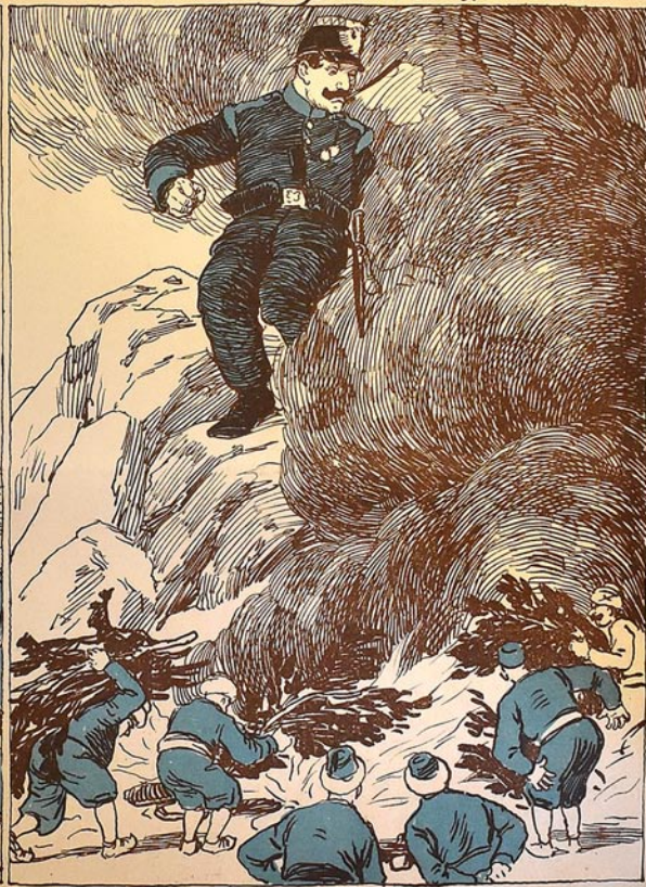
تورک لر: اگر دغلاری لنگ ایلدیخاق و شهر لری یاندیردب پوره چنمار داق — کن تو ناملار مملکتیز دن چخوب کتمه جکلد