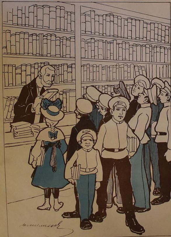
• درس باشلانان گونلر