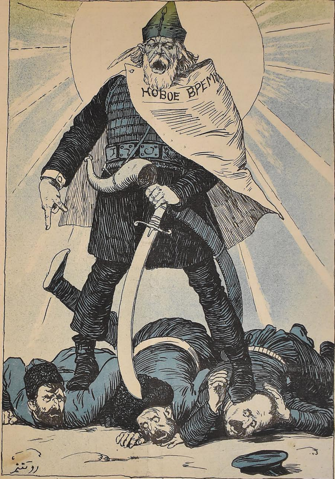
مینشیوف : جوان تورکلرک پولیتقاکی ملتچی لک در : تازه قانون ایله هر ملتته بر درجه مساوات و حقوق دیرمک ایستورلر حال بوکه بو انصافسزلیق در : بولغارلاره 'رودملازه' ارمنی لره 'آدوتونویما' دیرمک لازم در ...