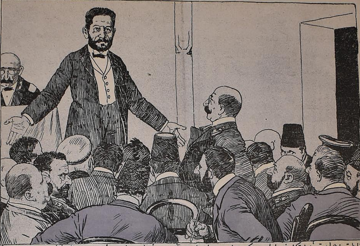
ناطق: جماعت من تکلیف ایلیورم که های مسلمان جمعیتنری بیغیشونلار نجات بهمیتتی نک باشنه