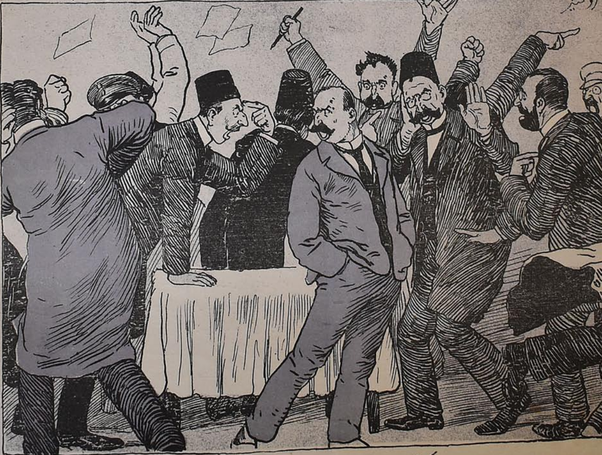
یغنیاغک نتیجه سی