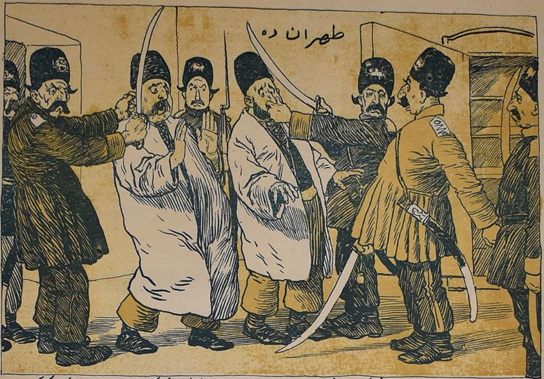
سز مشروطه طرفداری سز: یارک هرگز آلی بین تومان دیره سز یارک بورون تو لاغیر کسبله