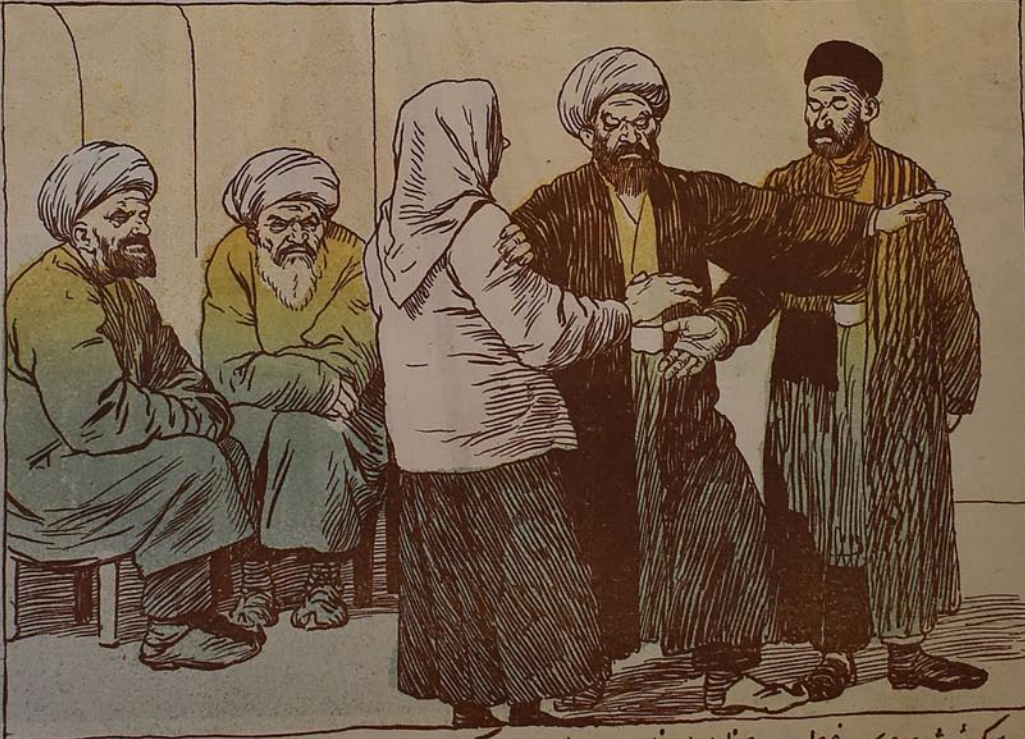
قریم حکمہ شرعیہ کی خطیب عظمیٰ ادغلی عبد الجباری تکیف ایدوب آروادندان آیریر ...