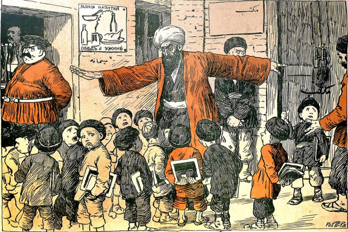
با لوده بناقاضي گنهنده آخوند: چشم اولون گيدين، اصول جديده ملتبندن بزه نه خير! بودر مليهان دکانندان گنه بزه بر قدر پول چاتار (ترقي نمازيه مندن)