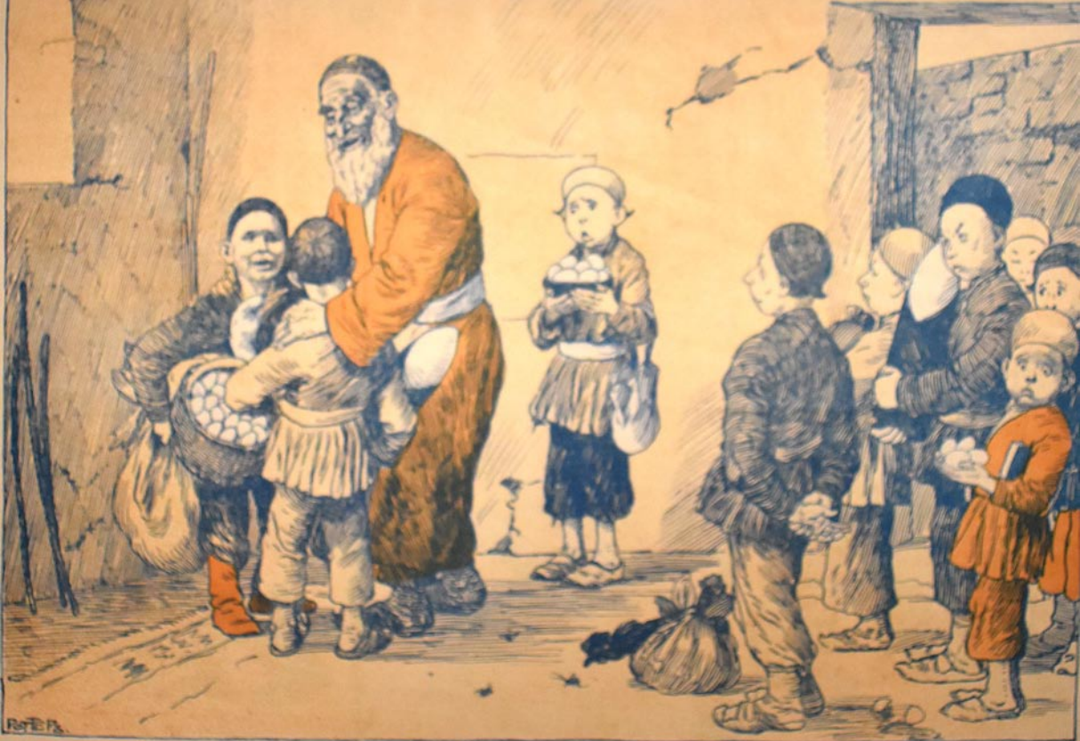
مکتب ده جمعه آخامی معلم: بزرگ بود! باغ سن های دان ذهن لی سن ...