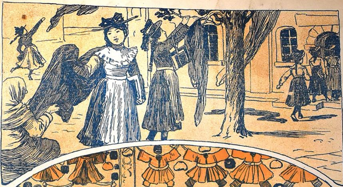
یوز ایل دن سورا ایران ده ملت مجسی