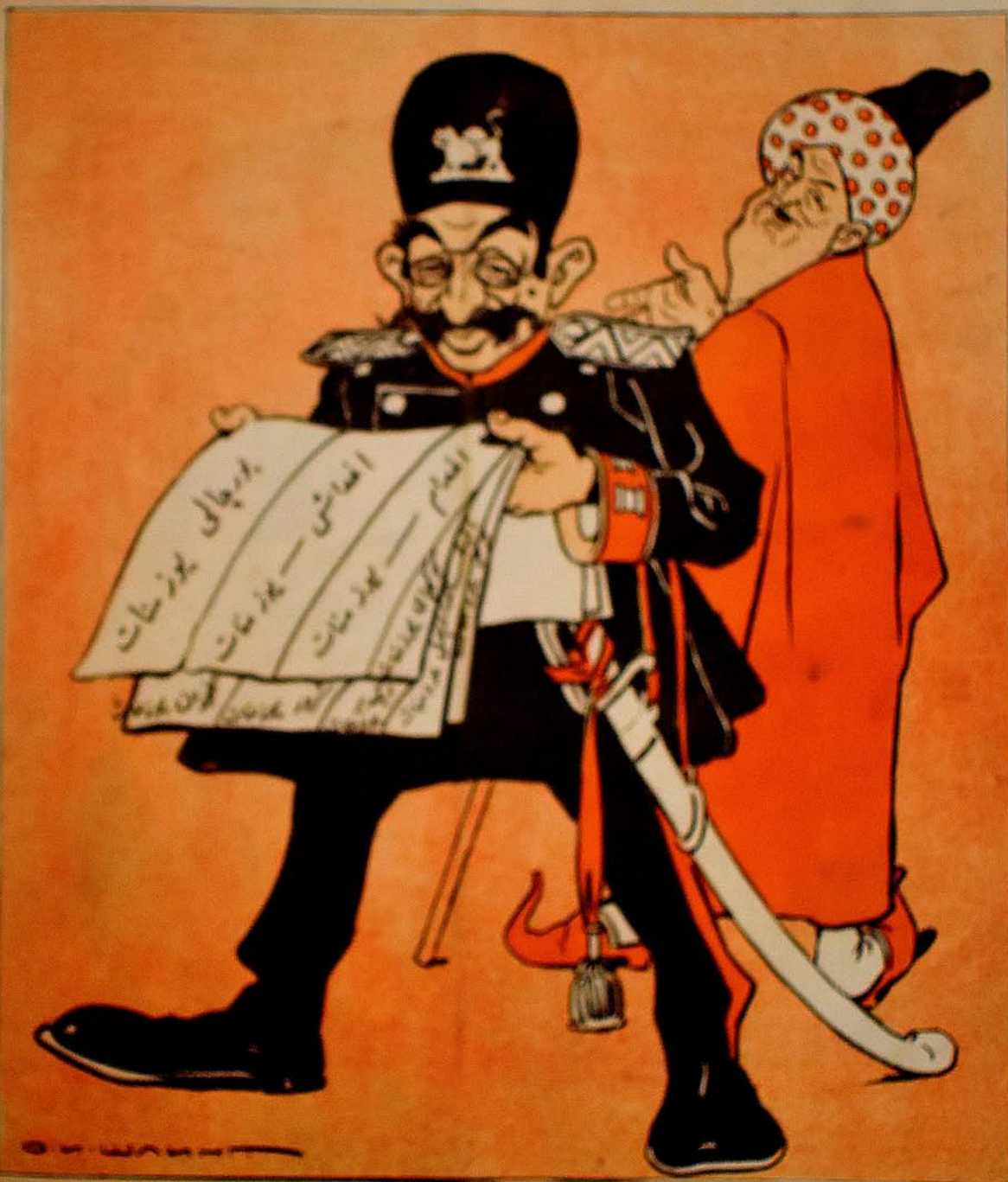
راج! نایب لقی لادک پری یوزستان (اکر تارس اولسه نوپر رسم ده اولاد)

۵۲ ادیبی ایل موللا ناسر ددینہ نهنی ۱۲ نکت ۵۲