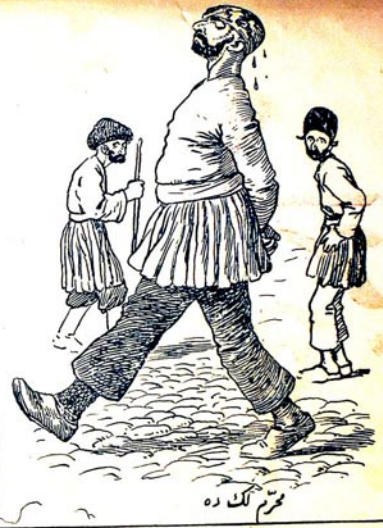
مترم لک ده