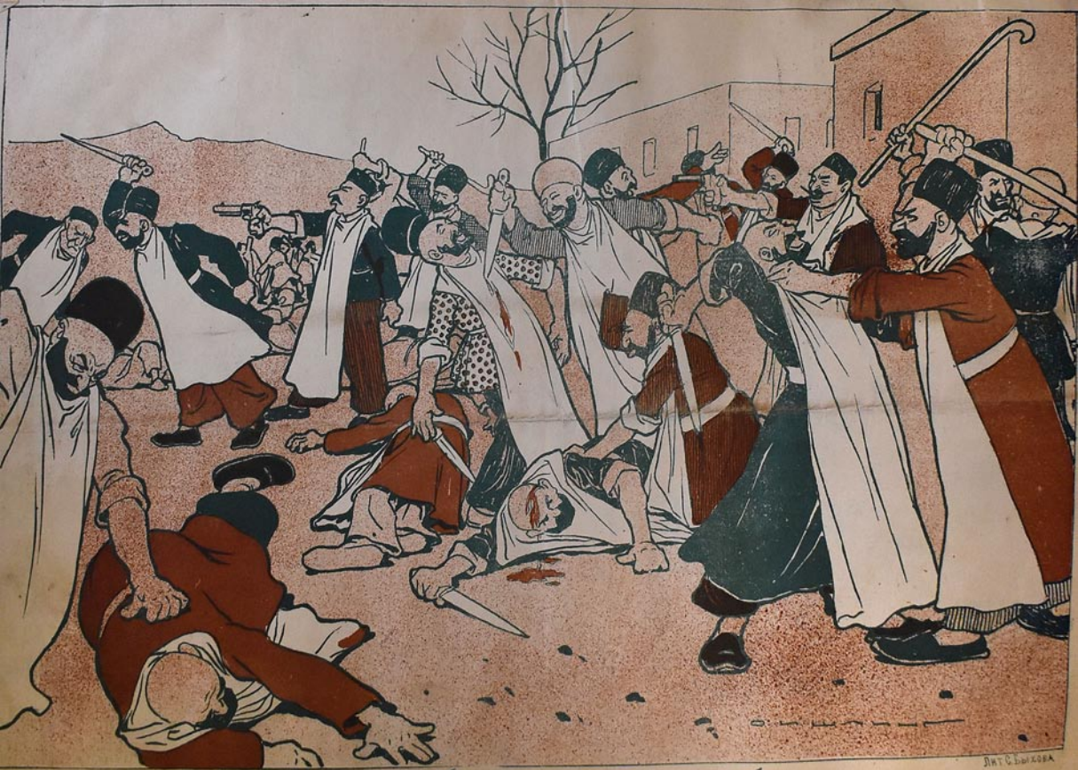
باکوده مشقح کندنه عاشورا کونی