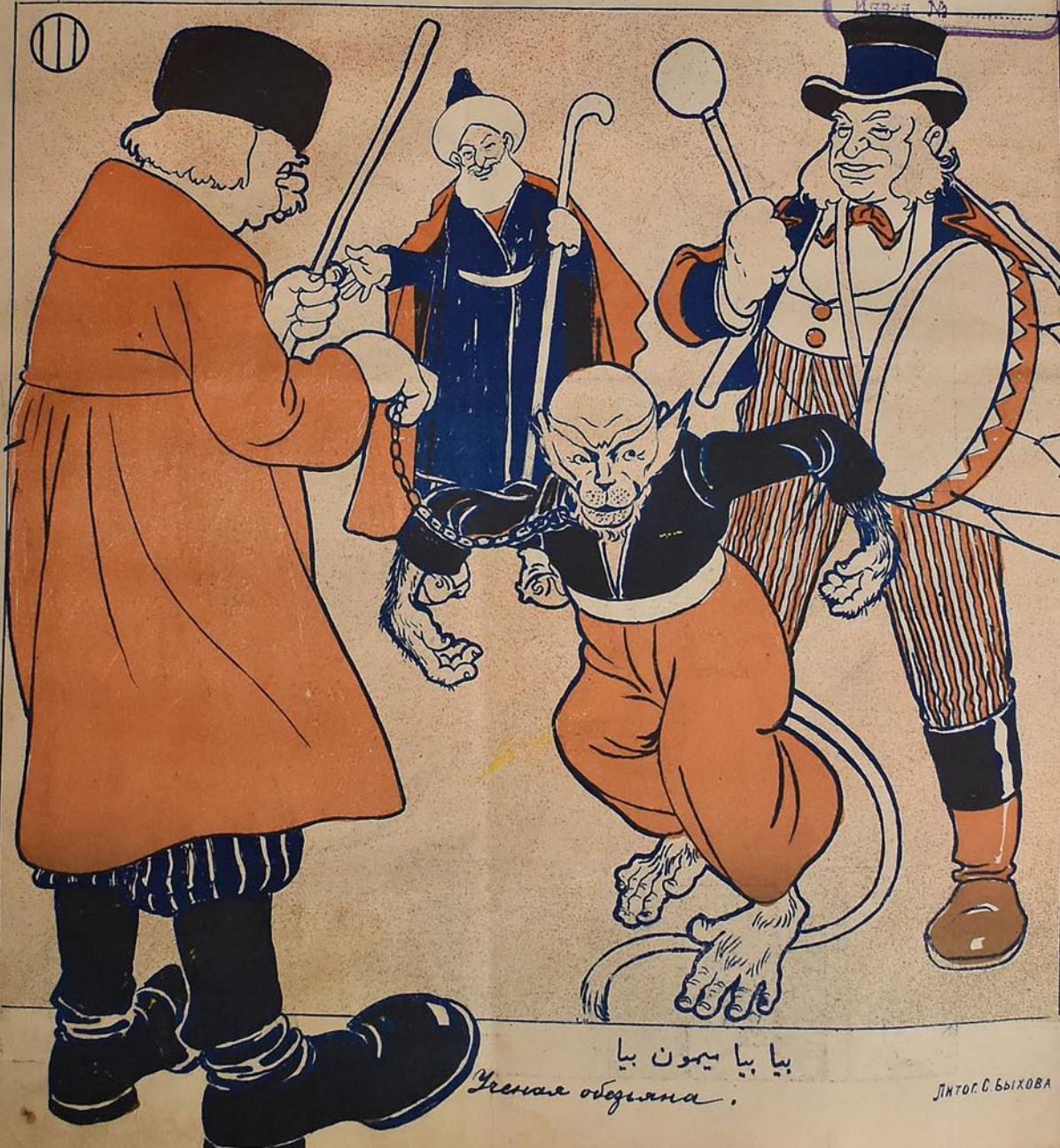
بیا بیا بیون بیا Ученая обедына.

پاک ۱۲ انجان مرکزی دولت ГОСУД. БИБЛИОТЕКА Издава №