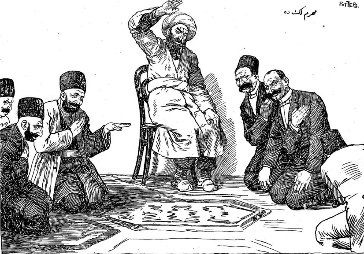
رفیقہ خاندانہ اللہ جمیع شروط پی لہ و غازیت یازانلارہ لعنت الہل سون چہات - آمین یارب العالمین !