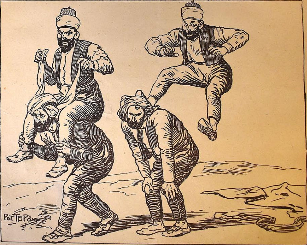
باطوم ده آجارا محالنده ملالار و رعیت