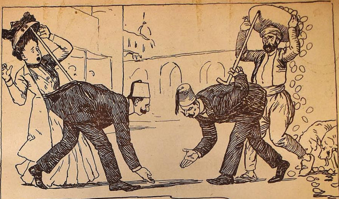
عثمانی ده سلا مشاق اصولی .