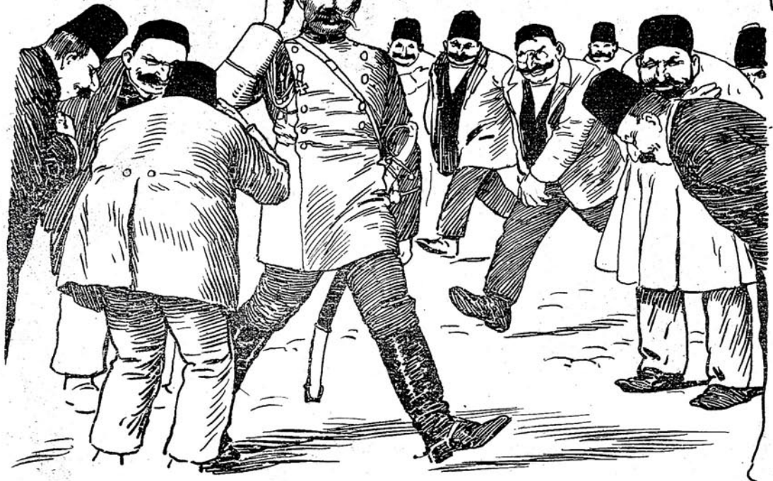
Когда не был Председателем мух. благотворительного Общества. جمعیت خیریه یہ صدر اولماشدان ایره لی