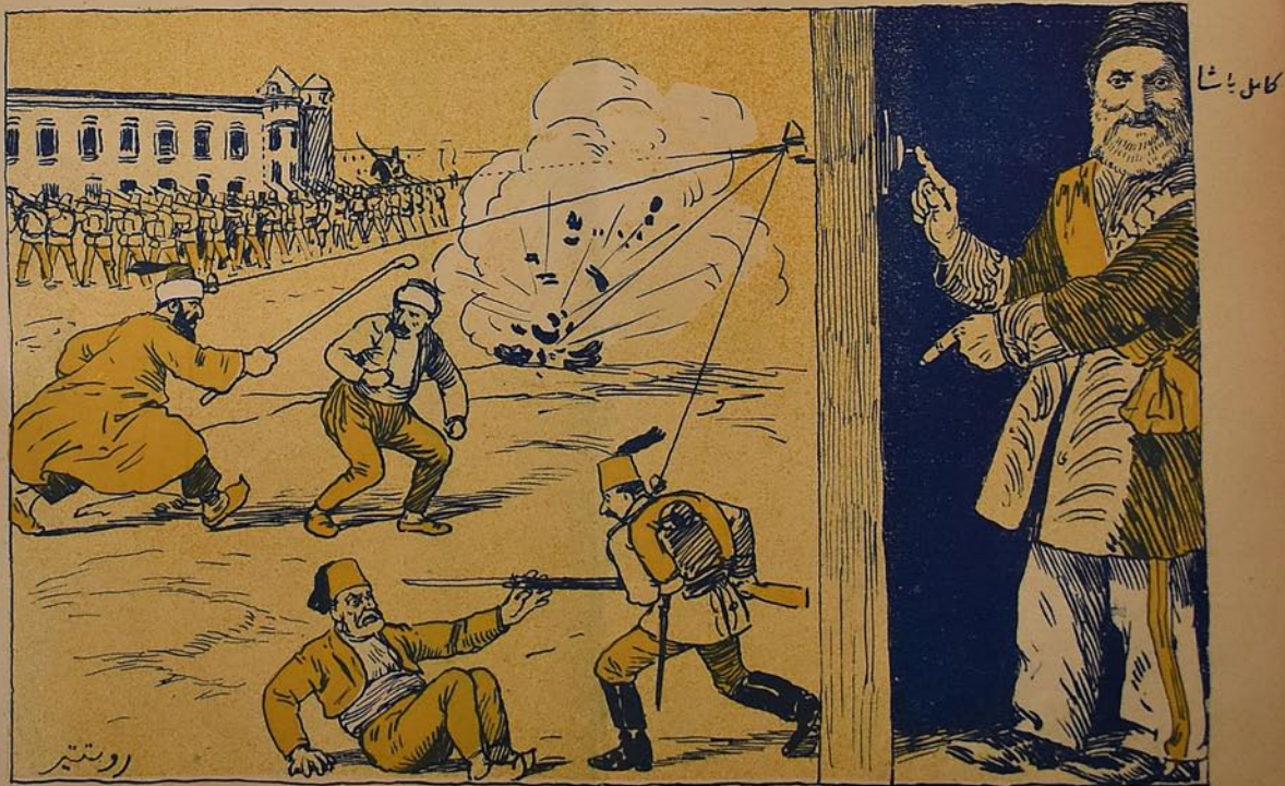
События 31 марта. (Кавказские)