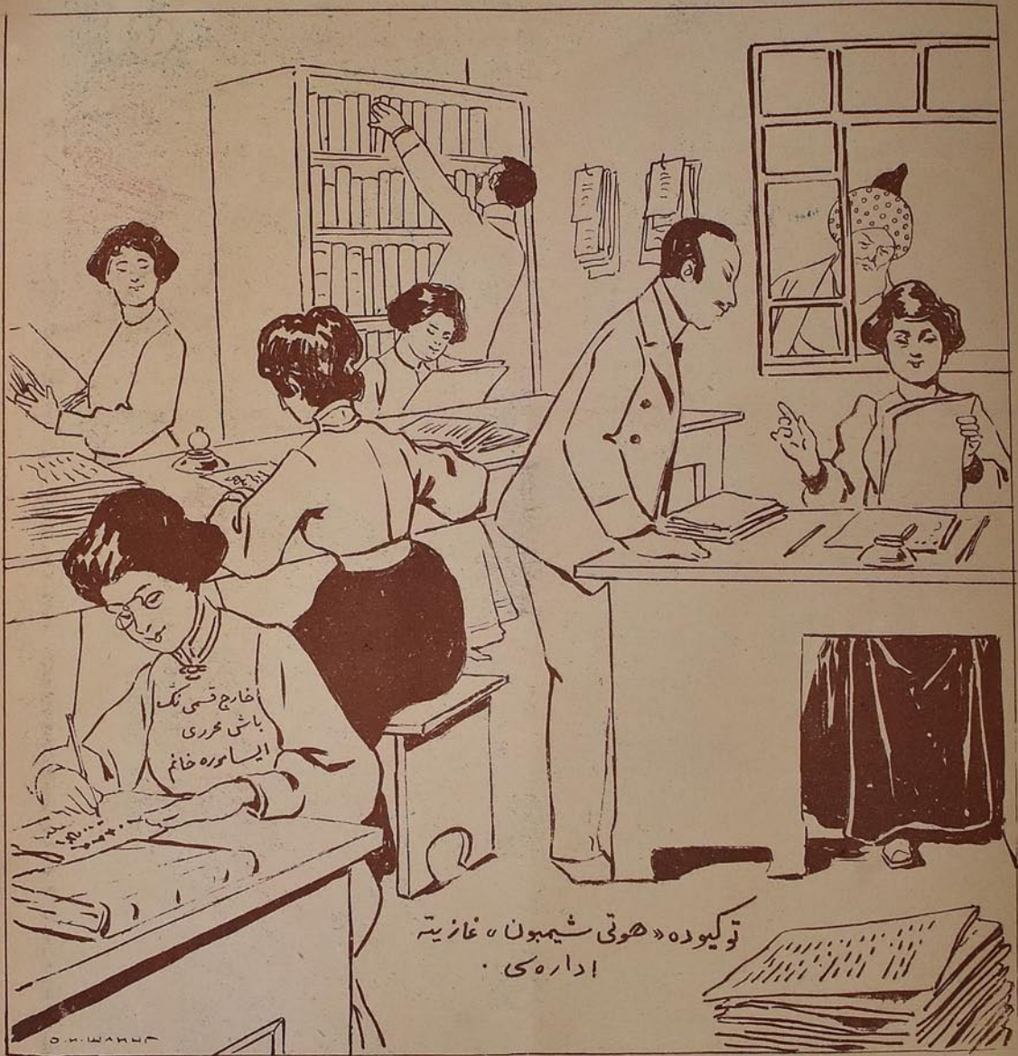
تویکوده «هوتی شیمون» غازیته اداره سی

... اگر یاپونیا ده آرو اتلار اوزی آپیتق کشی لر ایله بریرده ایشلمک عادت ایله مه سیدیلر — او دعه یاپونیا لی لار ده مسلمانلار کیبی ترقی یه چاتاردیلار (ملا عبد الرشید ابراهیموف)