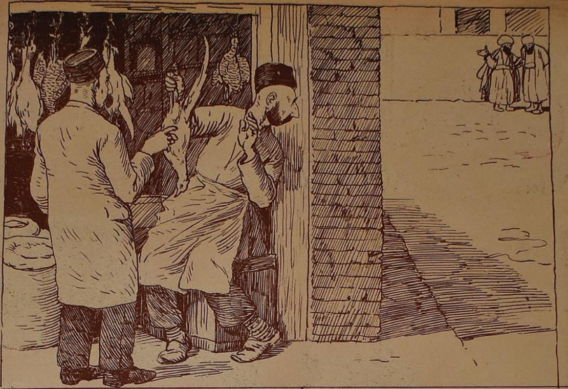
قارداش، تيز ادل، پولگني ويرگيت : ملا گلير . (شيت شهنده) Рагу Аллаха, расклатитесь скорей: мушма ичети.