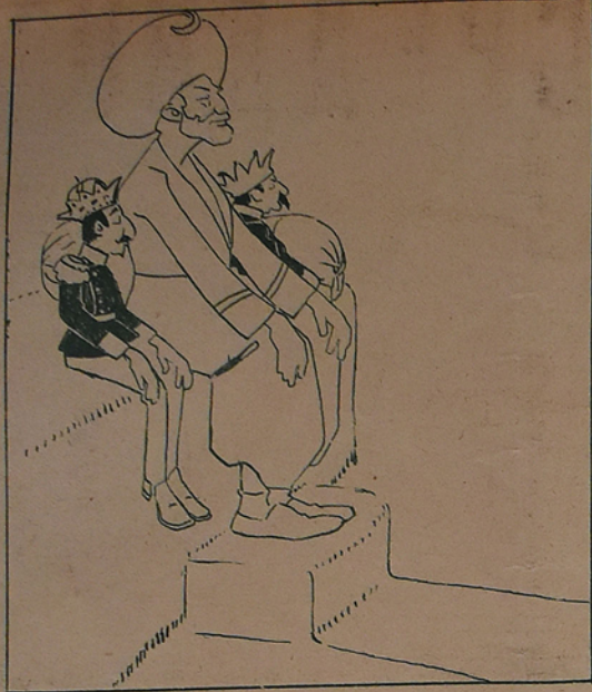
ایندیکی وقت ده