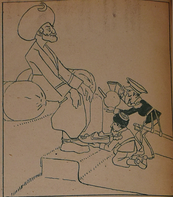
بر آز اول کرده