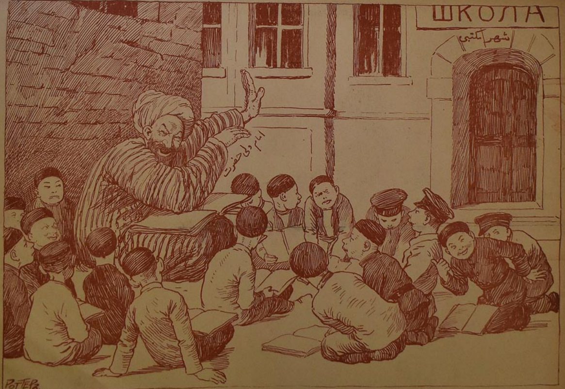
« اورینٹورگده بریمی محلہ امامی ولی حضرت سسلاناری ایاندربوب که شهر بولی ایله آچیلان مکتبده اوشاق اوخوتماق حرام در د یوفند. من جمله اوشانلاریسی مکتب دن کناد ایلورد که اوزی اولنلاری اوخوتسون » (وقت « غازیته سی » نوبر ۱۹۵۷ )