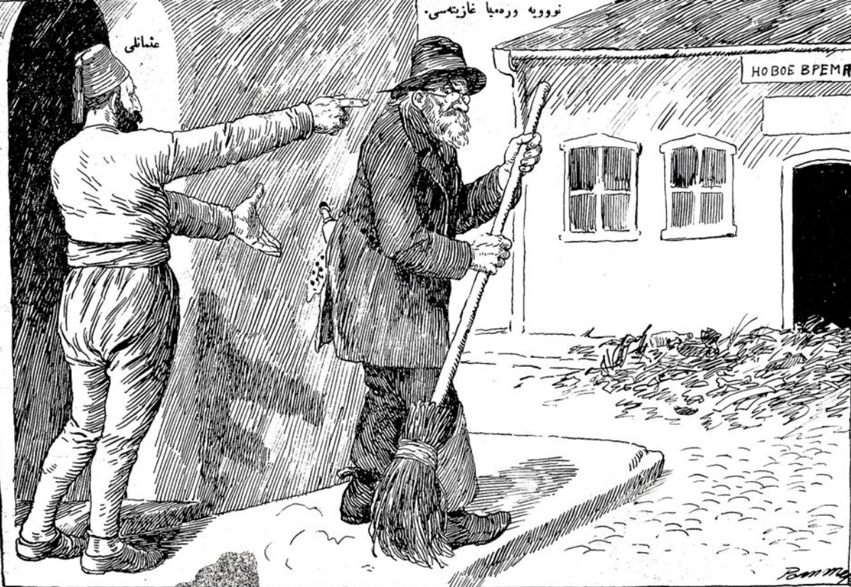
نووویه وره‌میا - عشائیلر، اوزگملرله آفتانومیا ورروب سملک‌کردن حق‌سزلی تیزله‌ملی‌مکرا! عشائلی: - اکر تیزلکی سه‌ویورسن، اولجه کرک اوز زیبگی تیزله‌سن