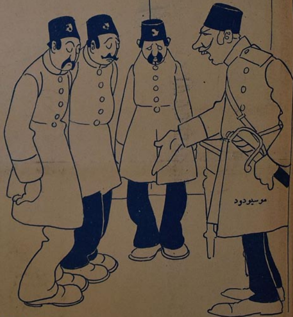
موسبودود - ایراتیلیر، بز یوردوبالیر کیبی تربیهلی، انسانیتلی اولمالی سکز.